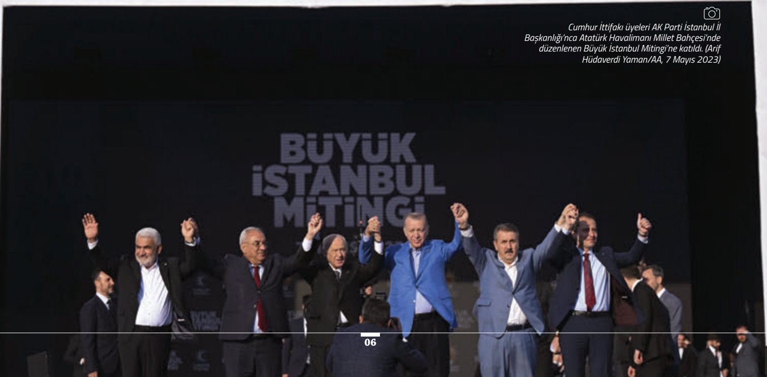
Cumhur İttifakı üyeleri AK Parti İstanbul İl Başkanlığı'na Atatürk Havalimanı Millet Bahçesi'nde düzenlenen Büyük İstanbul Mitingi'ne katıldı. (Arif Hüdaverdi Yaman/AA, 7 Mayıs 2023)