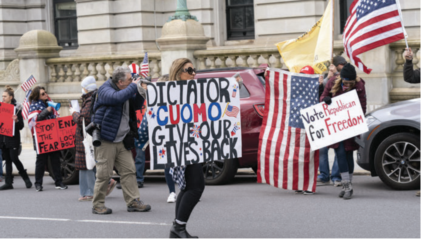
New York'ta Covid-19 salgınıyla mücadele kapsamında getirilen kısıtlamaların kaldırılması için protesto gösterileri düzenlendi. New York Eyalet Valisi Andrew Cuomo'ya diktatör yakıştırması yapıldığı görüldü. (23 Nisan 2020)

Beyaz Saray'da artık dünyaya liderlik etmeye gönülsüz bir başkan oturmaktadır. ABD liderliği kaybetmemek için büyük bir savaşa razı ve hazır mıdır? ABD'nin karşıtları liderliği elde edebilmek için büyük bir savaşa razı ve hazırlar mıdır? Yükselen ekonomiler, Avrupa ve Asya'daki eski müttefikler, ortaya çıkması muhtemel büyük savaş veya daha iyimser bir ifadeyle yarışta hangi tarafta yer alacaklardır?