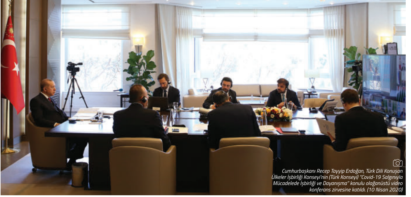
Cumhurbaşkanı Recep Tayyip Erdoğan, Türk Dili Konuşan Ülkeler İşbirliği Konseyi'nin (Türk Konseyi) "Covid-19 Salgınıyla Mücadelede İşbirliği ve Dayanışma" konulu olağanüstü video konferans zirvesine katıldı. (10 Nisan 2020)