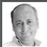
Vedat Bilgin profvedatbilgin@gmail.com

AK Parti'nin üst üste 19 yıldır katıldığı bütün seçimleri kazanması daha birçok sebeple birlikte partinin iktidarları süresince karşılaştığı sorunları toplumsal beklentilere uygun olarak çözmesiyle açıklanabilir. Bu durum aradan 19 yıl geçmesine rağmen partinin en önemli güç kaynağıdır.