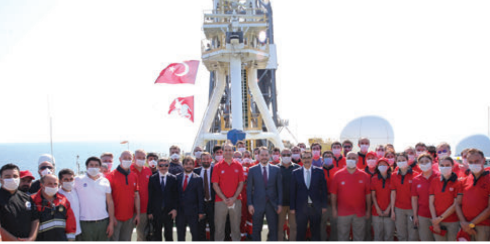
Cumhurbaşkanı Recep Tayyip Erdoğan "Türkiye tarihinin en büyük doğalgaz keşfini Karadeniz'de gerçekleştirdi" müjdesini verdikten sonra Hazine ve Maliye Bakanı Berat Albayrak ile Enerji ve Tabii Kaynaklar Bakanı Fatih Dönmez, Fatih sondaj gemisinden konuya ilişkin açıklamalarda bulundu. (21 Ağustos 2020)

dönem" ve Hazine ve Maliye Bakanı Berat Albayrak'ın "eksen" vurgusu yapmasını abartılı bulanlar temel bir noktayı kaçırmıyorlar. Bu başarı Cumhuriyet tarihinin belirli bir döneminde, hatta AK Parti iktidarının spesifik bir döneminde ve Albayrak'ın iddialı enerji politikasının meyvesi olarak ortaya çıktı. Bağımsız siyasi iradenin birçok krizle, iç ve dış vesayetle hesaplaşmasından sonra geldi bu başarı. Ve bu sadece bir başlangıç. Halk tabiriyle Ankara, şeytanın bacağına kırdı, gerisi gelecek inşallah.