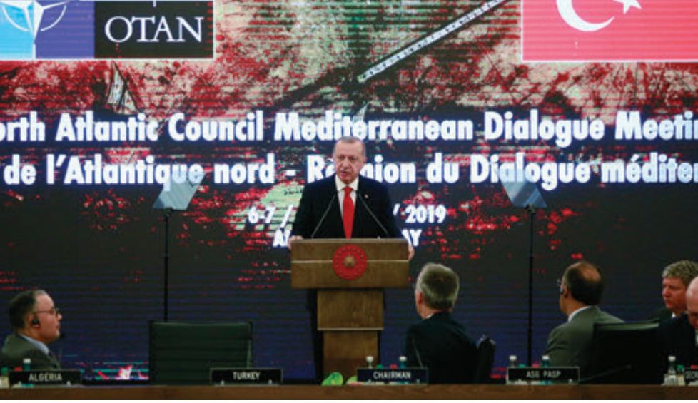
(Murat Çetinmühürdar/AA, 6 Mayıs 2019)