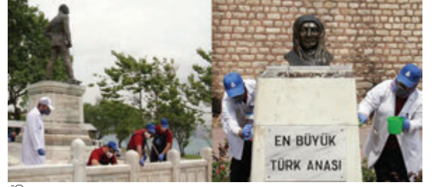
Ekrem İmamoğlu Sarayburnu sahilindeki Atatürk anıtı için özel temizlik ekibi tutulduğunu açıkladı. (25 Kasım 2019)

Kemalizm'in bu tür bambaşka yorum ve değerlendirmelere açık olduğu başka bir şeydir; onun