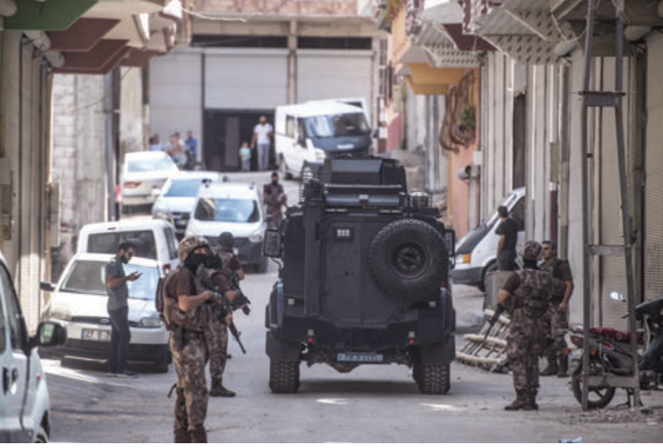
Güvenlik güçleri, çeşitli illerde terör örgütü DEAŞ'a yönelik birçok operasyon gerçekleştirdi.

kadrosunun söylemlerindeki “düşman Türkiye” olgusunun, pratikte somut bir düşmana çekilmek suretiyle fiili ve reel bir güvenlik tehdidi olarak Türkiye'nin karşısında duran bir terör yapısından söz ettiğini bilmeliyiz. Üstelik sistematik bir stratejinin ürünü olarak ortaya çıkan devlet benzeri yapısı ve sahip olduğu fiziksel-lojistik-finansal-askeri imkanları ile diğer terör yapılarından büyük ölçüde ayrılan bir tehdit idi bu.